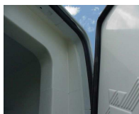
doppelte Türdichtungen für eine perfekte Isolation

Die DistriCool-Elemente passen sich lückenlos der Fahrzeuginnenkontour an ohne Anpassungen am Fahrzeug.