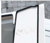
erhöhte isolierte Schalen für eine optimale Isolation