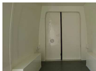
Innensicht VW Crafter