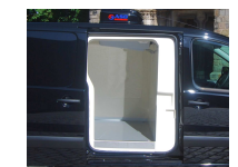
versehen mit 1, 2 oder ohne Seitentüren