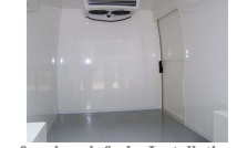
for eine einfache Installation der Kühlgruppe