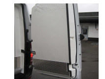
Hecktüren mit Stossleiste in Edelstahl