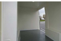
Innensicht VW Crafter