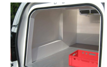
eine Breite Skale Boden Vollendungen