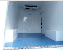
fugenfreie, hochglanz, hygienische Konstruktion