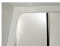
DistriCool Qualität, "empowered by PolyPan"