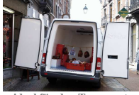
ideal für den Transport verderblicher Güter